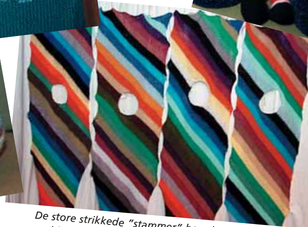
De store strikkede "stammer" her, skal sættes sammen og blive til et træ, der skal med på udstilling.