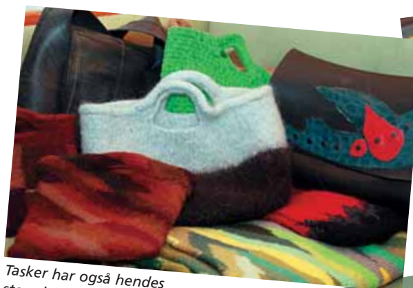
Tasker har også hendes store interesse.