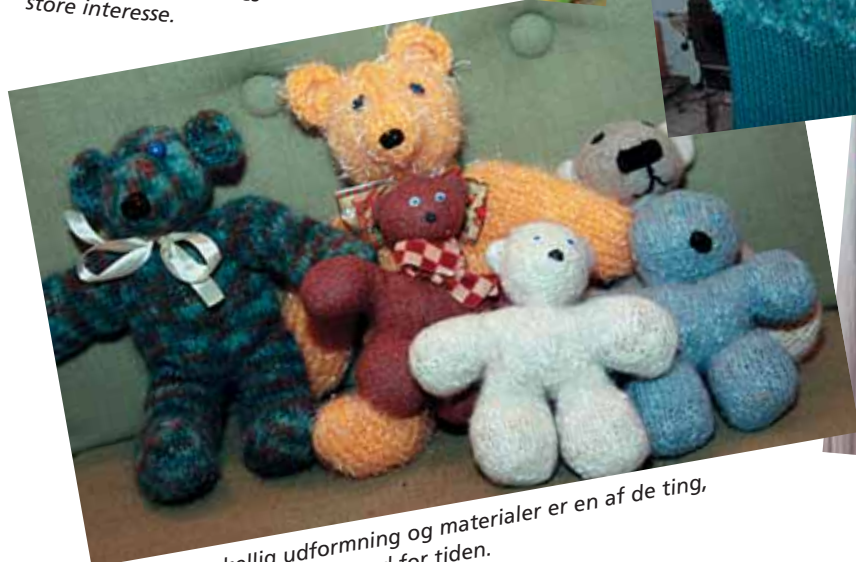
Bamser i forskellig udformning og materialer er en af de ting, som Britt Stagis arbejder med for tiden.